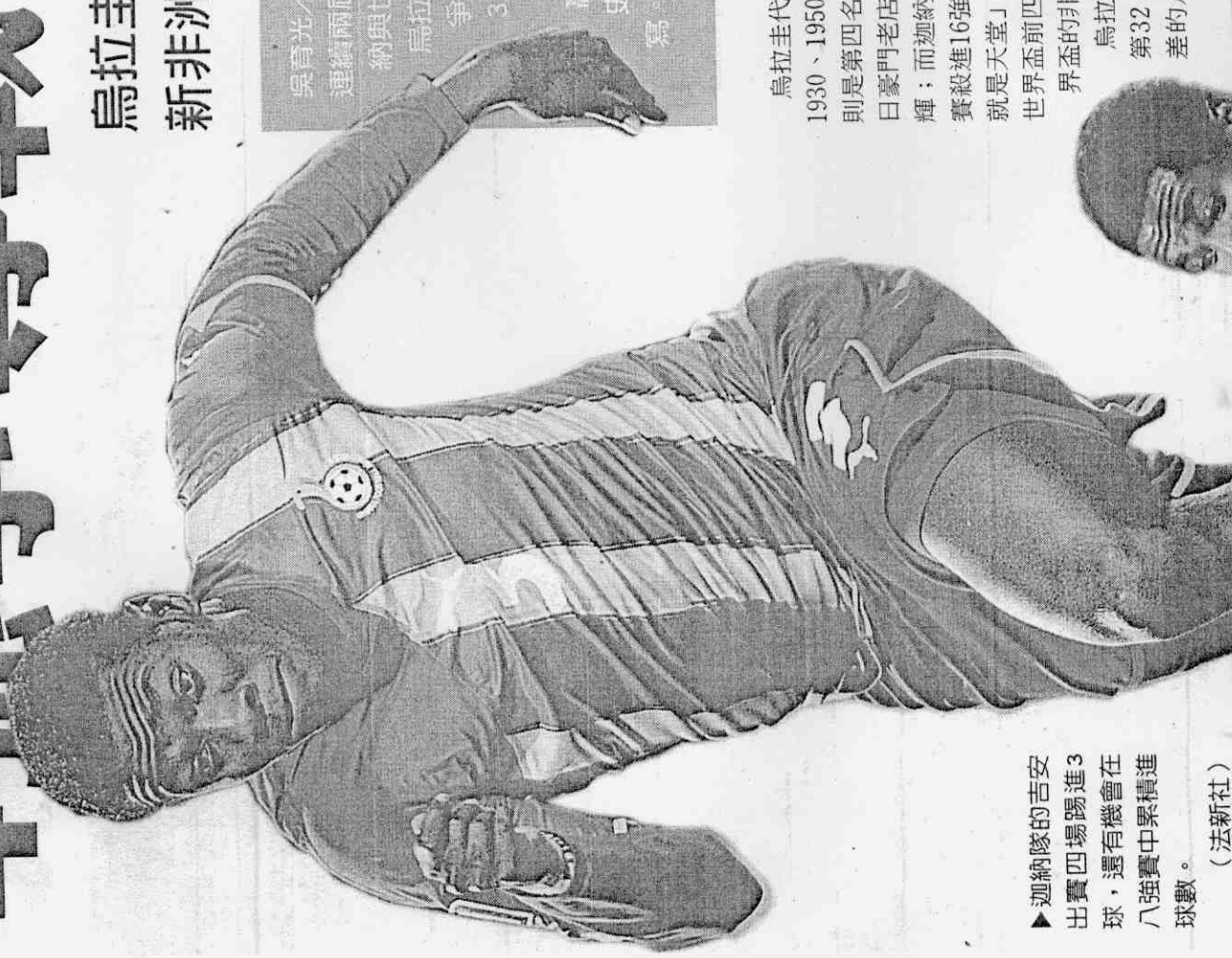
► 迦納隊的吉安出賽四場踢進3球，還有機會在八強賽中累積進球數。