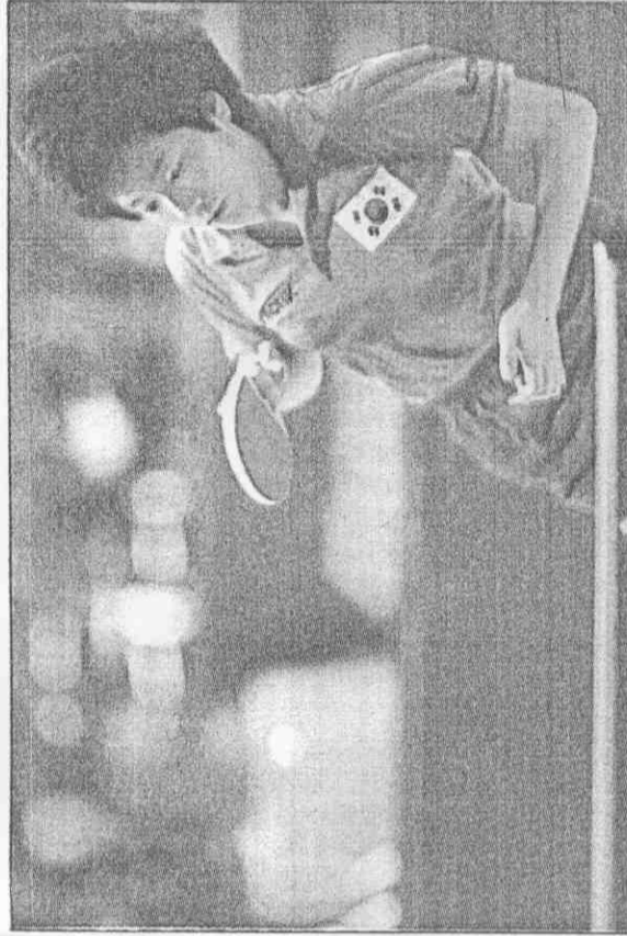
玄靜和是韓國的新國寶。