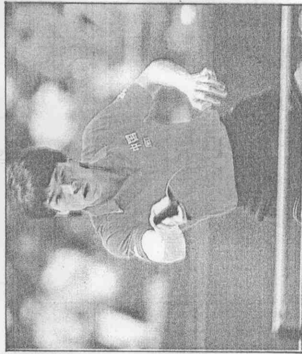
江加良的身手不愧世界第一。