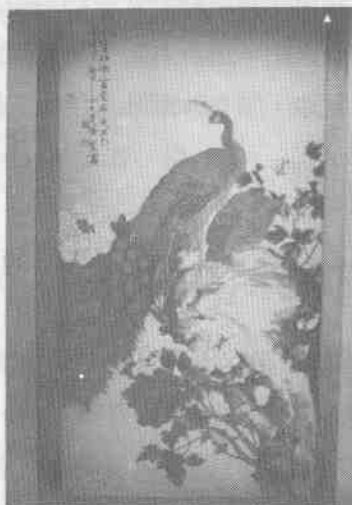
(6)代表本校參加民國七十一年臺灣省公教人員 書畫展——工筆孔雀牡丹展於臺中省立圖書館