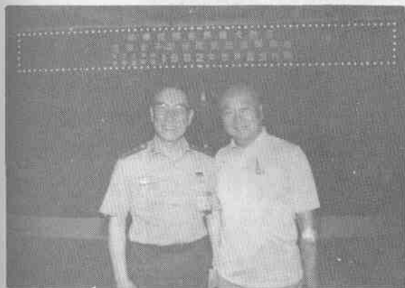
(1)與將理事長韓國將軍留影紀念——於臺北豐功宴後