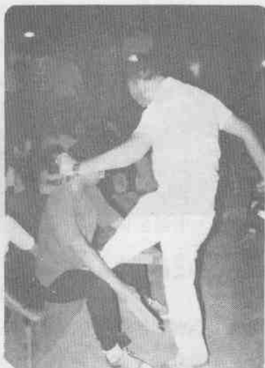
(7)晚會中表演內功之一——飛起一腿木即斷