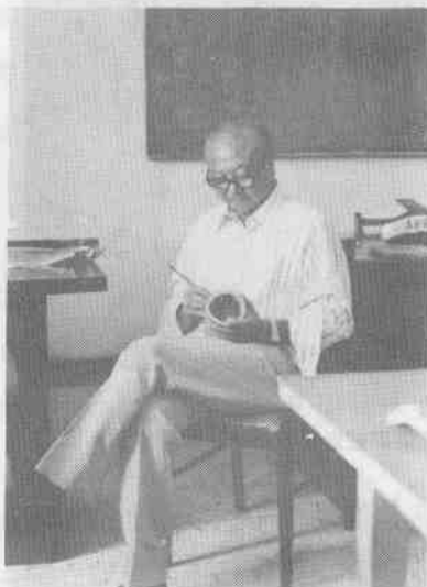
(8)閒時竹雕自娛——我國固有傳統文化