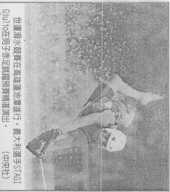
世運滑水競賽在高雄運池潭進行。義大利選手STAGI Giulio在男子赤足跳躍預賽精湛演出。

；女子傳統3項跳躍預賽，芬蘭喬塔領先。滑水 (Water ski) 跳躍有赤足跳躍、傳統3項跳躍；男子赤足跳躍預賽共有14名選手，參賽者多為歐美國家代表，中國也有選手參加；每名選手可以跳3次，再取最高的一次做為積分。