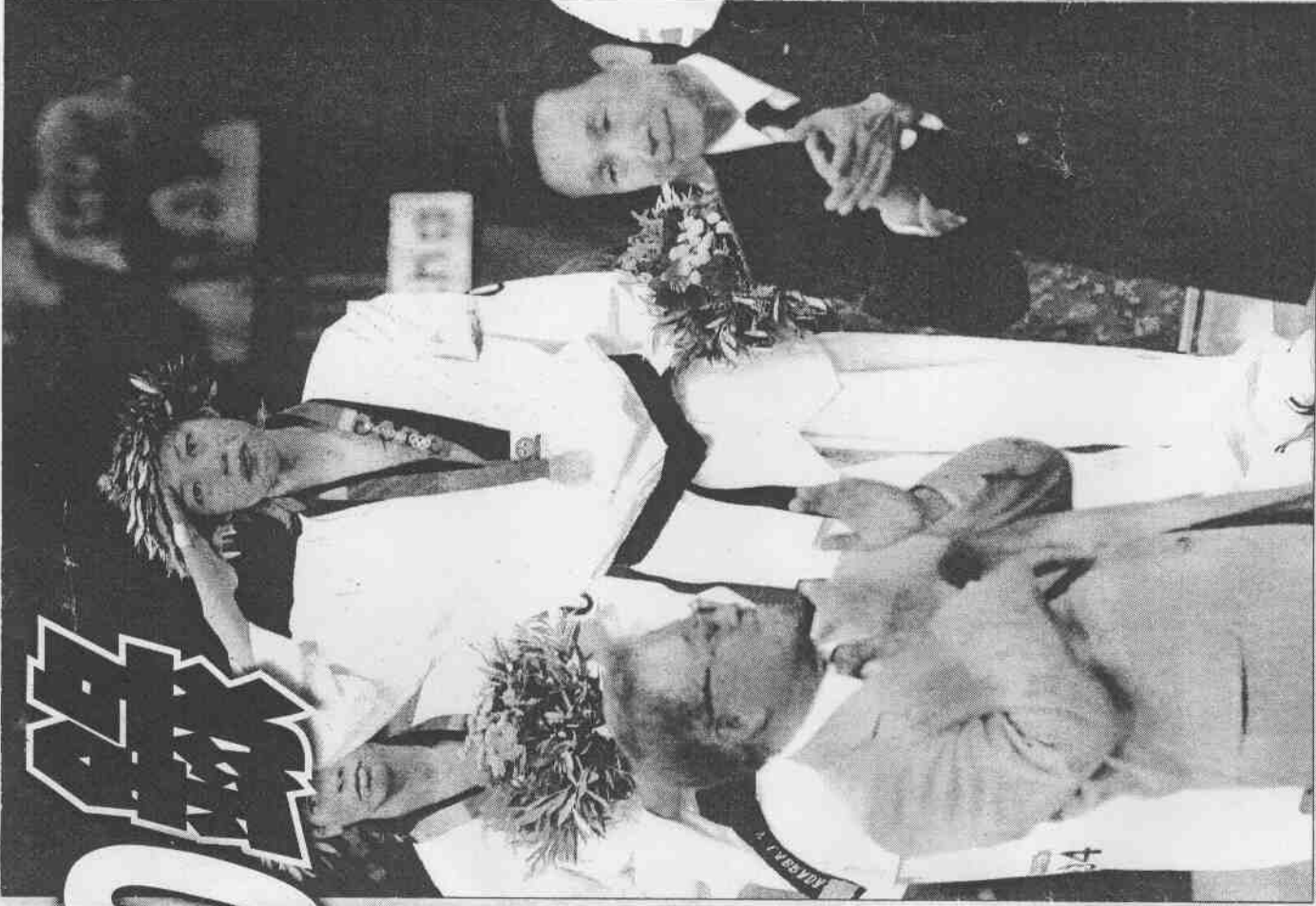
▲跆拳道女將陳詩欣，雅典奧運為我國摘下史上第一面奧運金牌。

過卻因世桌團體賽發生「落跑事件」遭到除名，隨後又因涉入「疑似援交」詐騙案破財、損及形象，2004年可以說是他流年不利的一年。