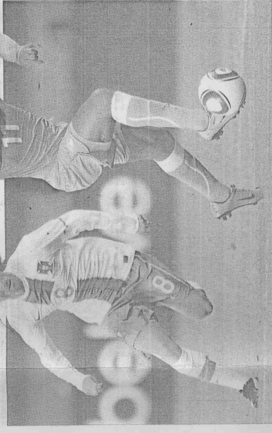
▲象牙海岸球星德羅巴(右)帶傷上陣未能建功；6支非洲球隊在第一輪僅有迦納拿下1勝。