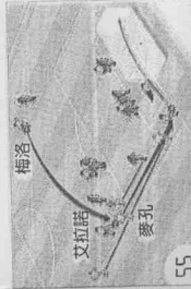
巴西麥孔進球示意圖 ▲巴西對北韓，第55分鐘巴西