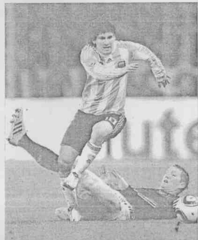
▲「小獅王」梅西是西班牙勁旅巴塞隆納隊的攻擊重心。

智利等進攻足球的信仰者突圍而出？明天開踢才見分曉。至於昔日理想主義的領袖巴西，這次在鄧加的執教下向實用足球修正，也要接受實戰考驗。（系列完）（李弘斌）