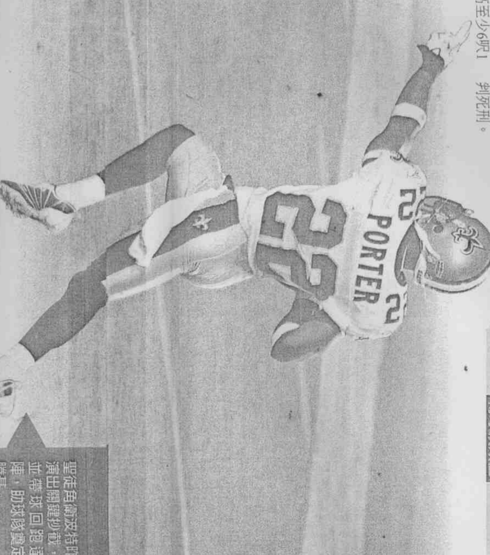
聖徒角衛波特昨演出關鍵抄截，並帶球回跑達陣，助球隊奠定勝基。