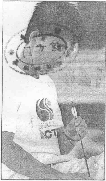
。行內分十材器等箭弓對鏢亨金↑