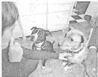
維克擁有的51隻鬥狗，其中47隻存活下來。

捱過生命中的低潮，赫克托和維克都找回了最初的自己，維克是個美式足球員，赫克托就是一隻普通的狗兒。