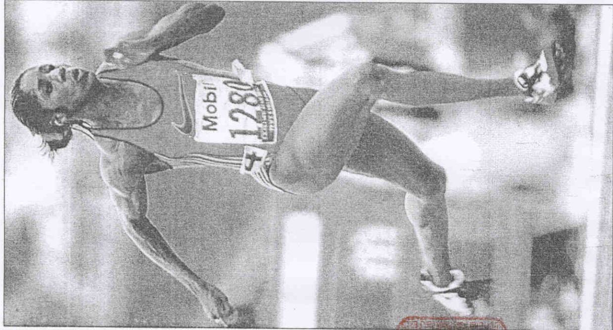
←美國短跑女將托倫絲，矢志拿牌。