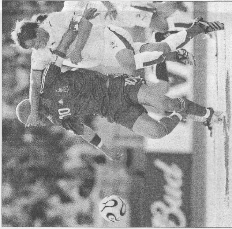
◀法國中場席丹(左)，被瑞士球員又拉又扯，全力阻撓。

老練的克拉卡說：「對付巴西這樣的強敵，如果你不能把每一個可能的進球機會，他們一定會給你一些教訓，我們最終還是吞下敗戰。」