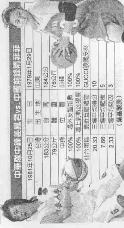
中華隊中鋒姜鳳君 vs. 中國前鋒隋菲非