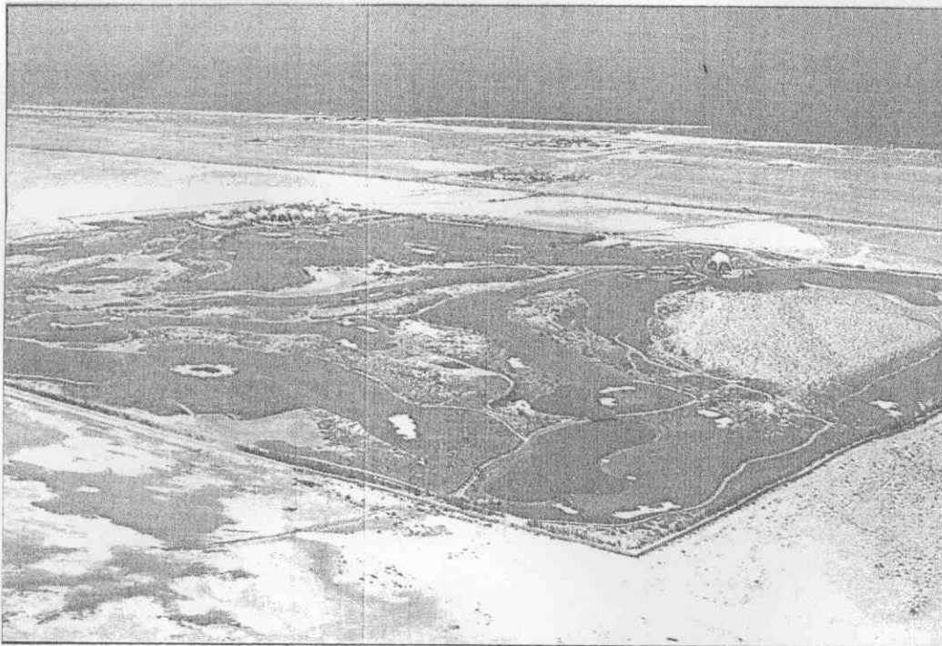
● 在沙漠中興建高爾夫球場，多麼不可思議！多金的阿拉伯人，能夠克服一切困難，在沙漠中造出綠意盎然的球場。這座球場位於阿拉伯聯合大公國的杜拜，國人對

杜拜最深的印象大概是在杜拜轉機，這裡有全世界最便宜的免稅煙酒。現在，杜拜還要告訴世人，他們也有世界一流的「高球場」。杜拜高球場土地不費分