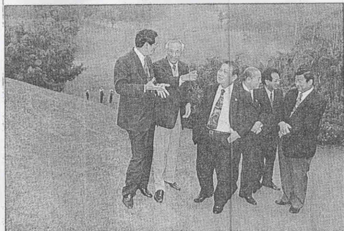
↑奧會評估小組視察高雄高爾夫球場，咸認適合做為亞運比賽場地。