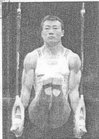
↑代表瑞士參加奧運體操賽的前大陸好手李東華，他曾贏得世界賽鞍馬金牌，這次單兵作戰也是志在鞍馬獎牌。