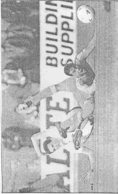
球丟倒絆隊林森披，(右)斯尼巴星球人黑的浦物利↑ (影攝運全用使家獨報本)