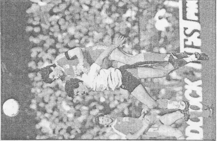
四賽出隊該為己(右)森漢長隊浦物利。場百

【本報綜合報導】經過上月的足球慘劇之後，「足球祖國」英國仍不斷有好戲上演。本週日英國傳統上最主要的杯賽冠軍戰「足協杯」登場，甲組聯賽冠軍也將產生，英國偉大的球會利物浦企圖來個「雙料冠軍」，但艾佛頓及兵工廠均具雄厚實力「抵死不從」。 英國足協杯已有一百一十七年歷史，今年是第一百零八屆賽會，不分組級採淘汰賽，也常有丙丁組球隊淘汰甲組勁旅的冷門戰果出現。四月十五日進入最後四強賽決賽，艾佛頓一比零擊敗諾威奇，而在愛菲爾進行的利物浦與諾丁漢森林之戰，都因球場悲劇延至五月六日重賽，利物浦以三比二獲勝。 台北時間廿一日，都來自利物浦市的利物浦與艾佛頓隊，將爭今年的足協杯冠軍，這兩支球隊在九十七年前，原屬同一個球會，但因分紅問題發生爭執，一些股東另起爐灶，成立了利物浦隊。 一九八五年這兩支球隊分別以英國聯賽及足協杯冠軍資格，角逐歐洲杯及歐洲冠軍杯，艾佛頓在歐洲冠軍杯稱王，而利物浦在英國球迷鬧事的死亡陰影下出賽，輸給義大利祖文特斯，屈居第二名，此後，英國球會被無限期禁止角逐歐洲職業杯賽。 利物浦隊被譽為是歐洲足球的一支「天兵」，近十六年該隊已四度稱霸歐洲杯，兩次歐洲足協杯冠軍及一次歐洲超級杯，十度在英國聯賽稱元，四次聯賽杯及兩次足協杯冠軍。 艾佛頓隊在五、六〇年代，曾經風光好一陣子，七度稱霸甲組聯賽，而到