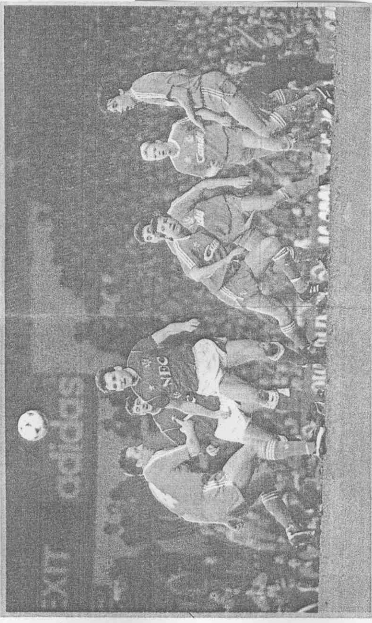
軍冠杯協足國英爭將頓佛艾與(衣紅)浦物利↑ (影攝運全用使家獨報本)

了七〇年以後，在歐洲只算是支中等水準球隊，不過從八四年恢復神勇，拿下英國兩個杯賽冠軍，八五年更壓過利物浦奪走聯賽盟主，並在歐洲冠軍杯搶元；八七年又再一次擊退利物浦，三年內兩奪英國