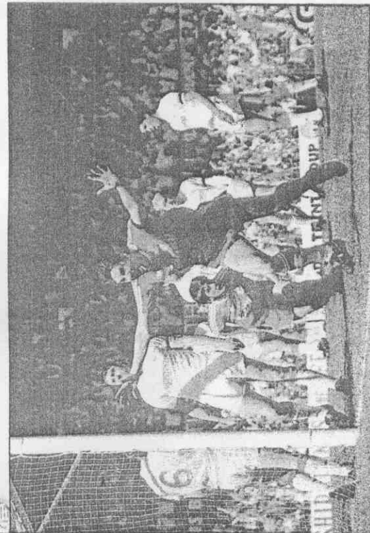
一第榜手射居躍已，後球入賽決準杯協足在(者臂張)吉瑞德阿↑ (影攝運全用使家獨報本)