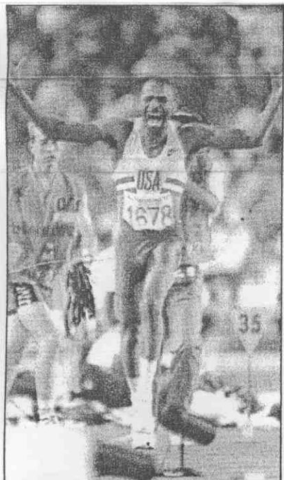
↑美國三級跳遠好手康利3日跳出18公尺17的「世界新紀錄」後，欣喜若狂。可惜因為超風速紀錄不算，但被承認為奧運新紀錄。