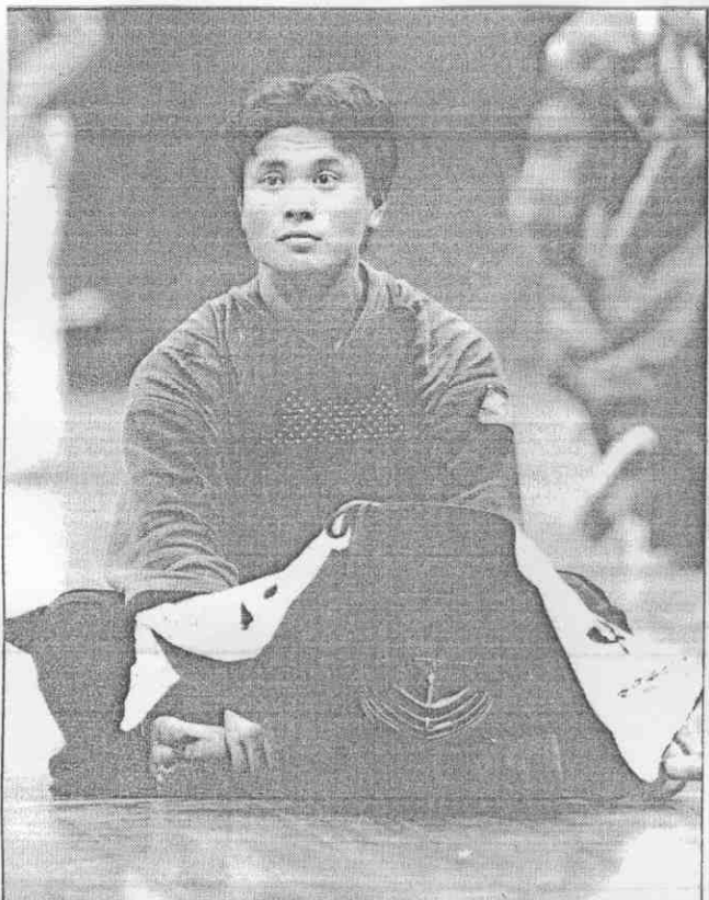
可無露面，手對待等中場坐靜，盔頭下解中建岳手好段四道劍。情表的何奈