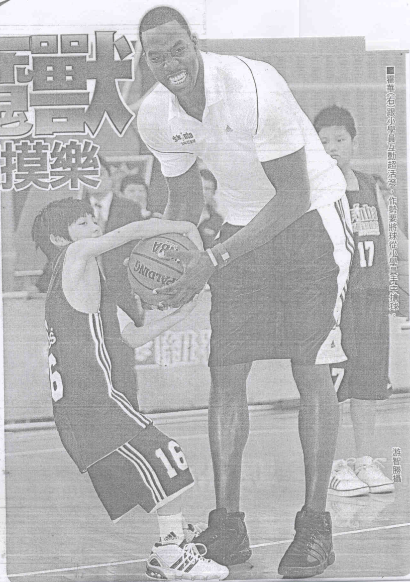
■霍華(右)跟小學員互動超活潑，作勢要將球從小學員手中搶球。

霍華先秀了一句中文：「你好嗎？」瞬間拉近大、小孩的距離，而且對小學員無厘頭的提問，更是兵來將擋，一一化解。小學員問他：「要怎樣才能跟你一樣壯？」霍華搞笑回答：「多做伏地挺身、仰臥起坐，還有多吃麥當勞！」