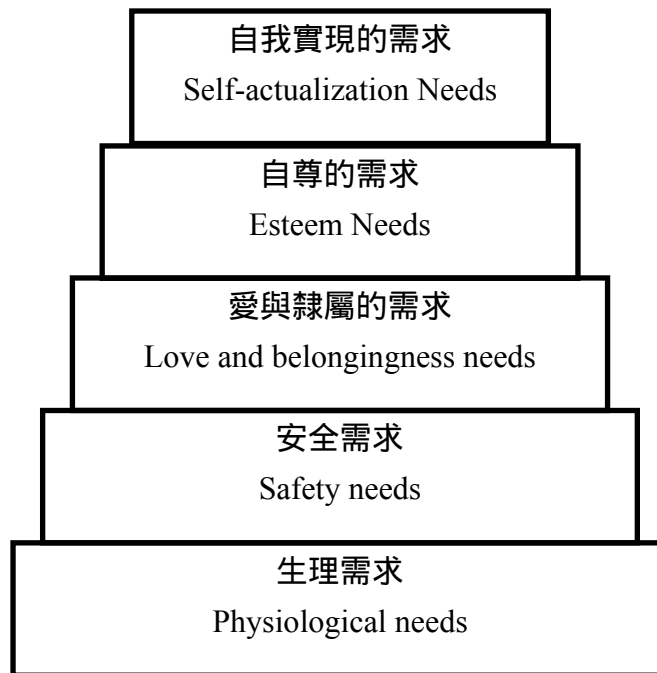
圖 2- 1 人類需求的層次關係 資料來源：引用自張春興、林清山（1989）。

5、自我實現的需求(Self-Actualization Needs)：即充分發展個人技能、能力及潛能等需要，在需要層次中，屬於最高層，並注重自我滿足自我發展與創造，實現其所欲達成的目標。