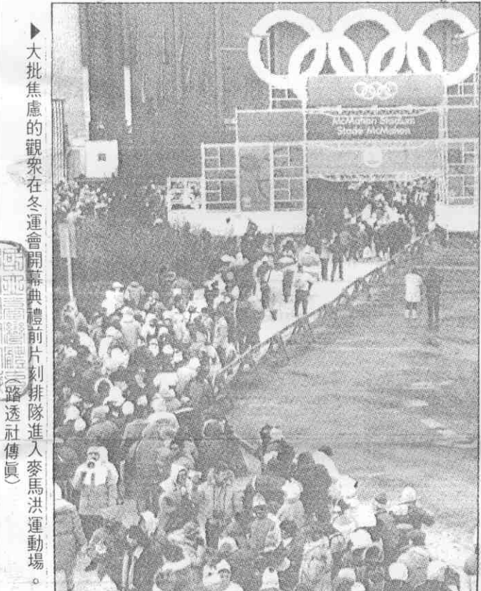
大批焦慮的觀眾在冬運會開幕典禮前片刻排隊進入馬洪運動場。

高舉一面白色的奧運大旗，在空中飛翔。 加拿大總理穆羅尼在體育場接受電視訪問時說，卡加利冬季奧運「不但是運動員，也是世界和平的重要工具」。 穆羅尼並說，這次冬季奧運有助於加拿大人的團結。他說，「我們多年來