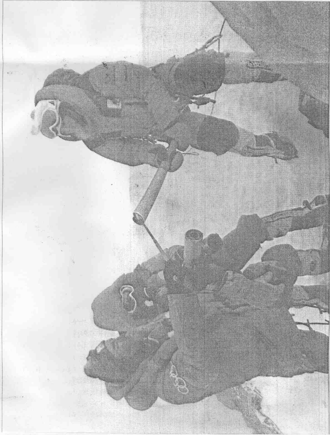
▲北京奧運聖火8日9時11分成功登頂聖母峰（珠穆朗瑪峰），聖火登頂隊員在山頂交接點燃火炬，這是奧運聖火首度傳經世界最高的聖母峰。

奧運火炬珠峰傳遞被比喻為北京奧運的「首枚金牌」。這次活動受到各國新聞媒體的廣泛關注，《人民日報》、中國新聞社等十家大陸媒體，路透社、BBC、共同社、德國電視一台和二台、香港TVB以及CZ等七家境外媒體，受邀採訪了珠峰傳遞聖火的奧運盛事。