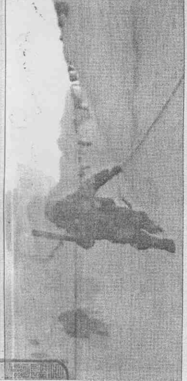
▲聖火進攻聖母峰的過程中，傳遞隊員必須克服撲天蓋地的大雪，還必須攀爬陡峭的岩壁。