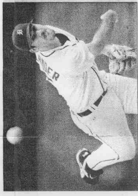
▲老虎隊速球王子韋藍德，獲選美聯年度最佳新人獎。