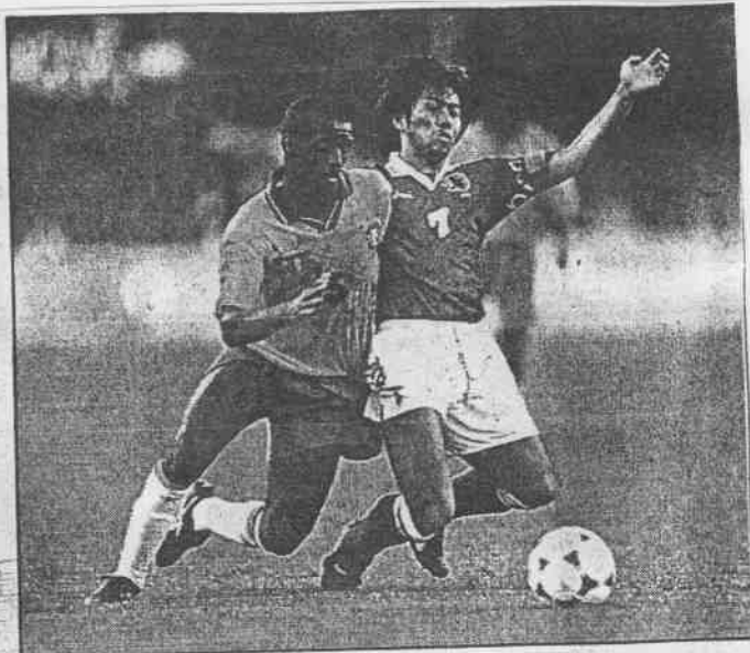
←美國女子體操隊摘下美國歷來第一面奧運女子成隊金牌。

→日本奧運足球隊歷來第一次擊敗巴西，令日本全國驚喜若狂。