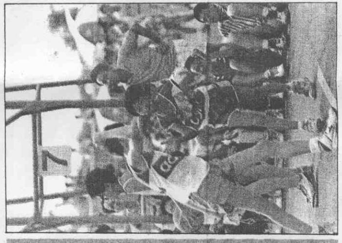
球隊怪名百出，諸如「肉腳」、「毒藥」、「怪頭」、「怪肉絲」、「黑皮」、「呆腳」、「求救」、「發瘋」等平常不大討人喜歡的字眼，昨天都一一出籠，也為大會平添了不少輕鬆氣氛。(實習記者 梁曙娟)