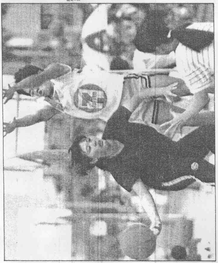
↑現出常也賽球在作動級高。景全觀社的賽牛鬥球籃三對三