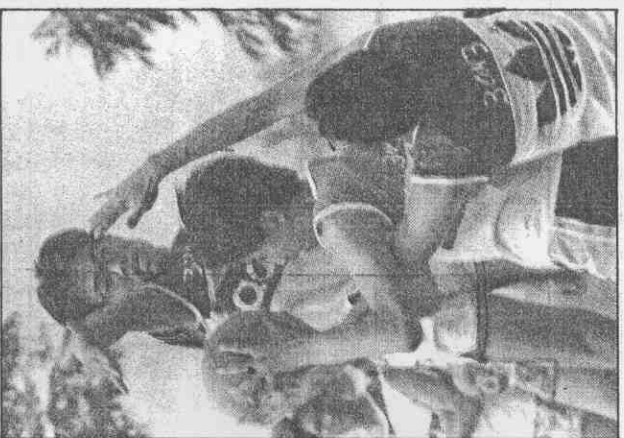
↑時時頭鏡的認真動作，防守身貼。見可

組冠軍參加八強決賽，取得與韓國同在一組。如此將可爭決賽的三、四名，成績將比上屆進步一到二名。 同組的香港、孟加拉實力屬弱，都不足對中、菲構成威脅。 中華隊若在預賽不敵菲隊，複賽將遭遇日本、大陸，恐怕就難如願打進四強決賽了。