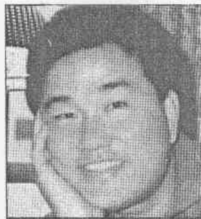
趙士強： 27屆世界錦標賽打擊王