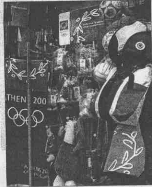
▲▲雅典經濟部大樓，昨天又傳出有人埋炸彈，所幸只是虛驚一場。 ▲雅典市區到處有賣奧運紀念品的商店。 ►雅典奧運進入100日倒數後，整個雅典市洋溢著濃厚的奧運味。

游宜權／綜合報導 儘管外界擔憂攝影、甚至有人謠傳美國可能率先退出今夏的雅典奧運會，美國奧委會(UISOC)昨天強調，美國奧運代表團不會因為希臘首都雅典五日發生的小型爆炸案，而退出本屆雅典奧運會。 美國奧委會發言人塞柏說：「我們的立場未改變。我們非常期待美國代表隊能參加八月舉行的雅典奧運會。」 塞柏說，美國對奧運主辦單位的安全措施有信心。雅典奧運將於8月13至29日舉行。 希臘政府表示，由極端份子在雅典市郊警察局附近發動的全起土製炸彈爆炸案，和雅典奧運完全沒有關聯。不過由於爆炸發生時間距奧運開幕正好100天，地點又在雅典市，還是引發國際社會矚目。