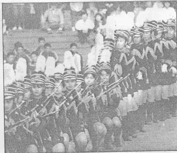
↑國際商工儀隊表演各項操槍動作，博得觀眾好評。