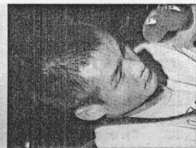
文圖遺 昌昌（見深夜 邱文也也在深 林乘文也也在 成，林乘文也 方昨晚移送林 檢團成，林乘 集團，林乘文 建捕。