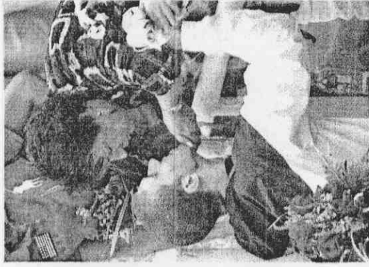
菲爾普斯的母親(右)也來到現場為兒子的優異表現加油打氣，盼許他達到8金目標。

←美國「飛魚」菲爾普斯(前)在個人200公尺蝶式以刷新世界紀錄的成績，拿下他本屆奧運的第4面金牌。