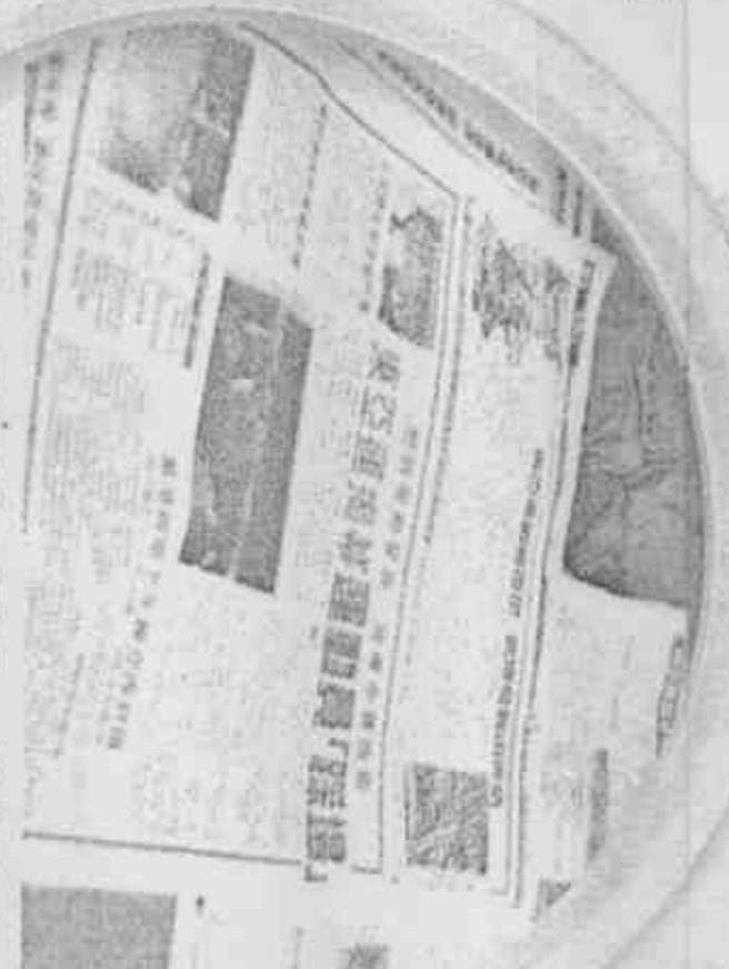
港報東方日報與太陽報，都對本屆東亞運提出批判。

一名香港市民吳先生表示，他與好友一起去觀賞足球，手中抱著2個月大的嬰兒，沒想到入場時，卻遭工作