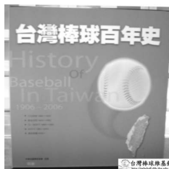
圖 6：臺灣棒球百年史