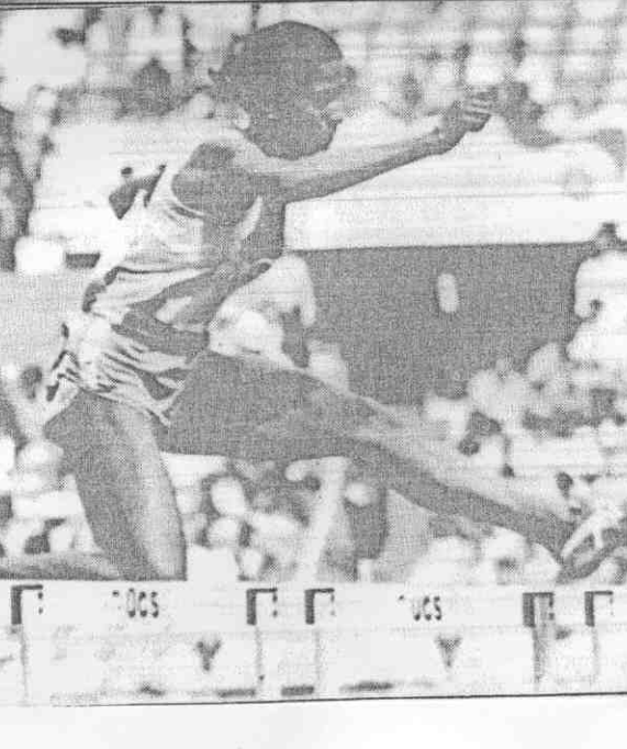
亞運田徑賽女子四百公尺低欄，以五十六秒〇八贏得金牌的印度烏莎。

亞運金牌僅止於「四冠」？各方矚目烏莎·更上層樓 亞運比賽到今天，個人獎牌仍僅止於「四冠王」，到射箭賽結束為止，有五位選手得到四面金牌。 韓國的男射手楊昌勳，大陸體操選手李寧，射擊選手許海峰、邱波，日本游泳選手藤原勝教等五位都獲四面金牌。這五位選手當中，李寧另外還得兩面銀牌，藤原及楊昌勳另保有一面銀牌，所以如果以獎牌總數來說，李寧最多。除了李寧獲六面獎牌外，大陸射擊選手中明星。 但是這次只獲三金一銀。現在大家把眼光放在印度短跑女將烏莎，她已獲四百中欄一面金牌，又報名參加一百、兩百、四百、四百接力、千六接力，只要再添四面金牌，就是明星中的明星。