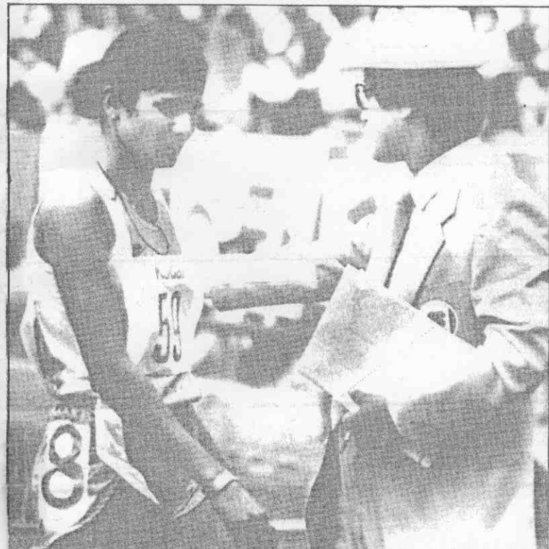
抵先率(左)罕拉伯亞·妮珊手選度印，賽決尺公百八子女會運亞新刷六三秒三分二以罕拉伯亞管儘，她近接判裁賽徑名一，後點終達。議抗式正出提已員官度印，格資消取被而早過道搶因却，錄紀運亞

巴林四百公尺中欄好手哈馬達，以四十九秒三二破亞洲紀錄。這也是巴林在第十屆亞運所獲得的第一面金牌。 大陸的朱玉清創下女子五八〇分其實遠勝五五九四分亞運舊紀錄；若非八百公尺跑得太過放鬆，朱玉清應該可以破她自己的五五六六分亞洲紀錄。 撐竿跳高是大陸吉澤標與梁學仁對峙的局面，今年方以五公尺五五刷新亞洲紀錄的梁學仁敗陣，吉澤標以五公尺四十奪得金牌，並破亞運。