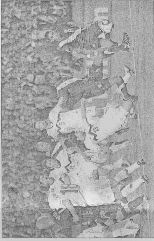
▲美國與斯洛維尼亞之役，美隊艾杜(右2)踢進第3球，裁判認為美隊先犯規而取消。

其實美國與斯洛維尼亞之戰，美隊在下半場也吃了裁判的虧。馬利籍裁判庫力巴利(Koman Coulibaly)取消美隊由艾杜錫連的第3球，然而在反覆觀看重播後，似乎也看不出美隊到底哪個球員犯規，美國隊該贏的球因而沒贏到手。