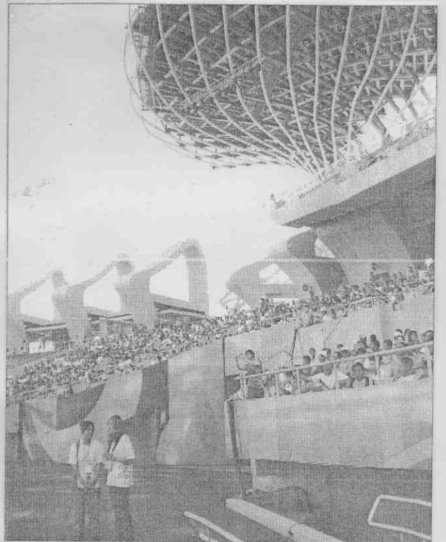
世運主場館第一戰 飛盤賽 昨天是世運主場館第一戰，由飛盤比賽拔得頭籌，包括美國、日本、加拿大、澳洲、英國及地主中華民國等強隊參賽，也吸引了上萬民衆到場分享世運主場館的美景和台灣最豪華體育場的氛圍。(圖文：魏冠中)