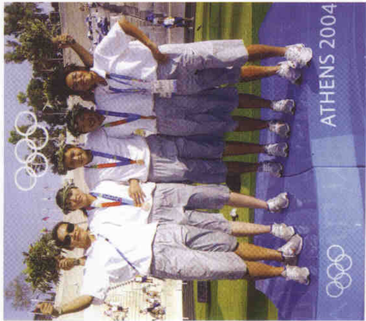
●袁叔琪（中）於2004年希臘雅典奧運與隊友合影。

結束了相當愉快的訪問，叔琪好奇的問我們，為什麼平凡如她，卻特別受到媒體關注，我告訴她，或許在這個人人都在偽裝自己的世界裡，像她這樣真性情的人不多，所以才會特別有話題，這樣的答案，叔琪笑了，還開玩笑的告訴我：「在凡人裡，妳還算有智慧的！」這就是袁叔琪，一個有點臭屁，卻很努力，清楚自己，真性情的勇敢女生。