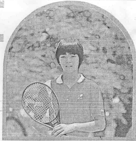
的衣紅穿愛，紅燦木鳳凰南台的月六 。中葉綠花紅在浴婷思王