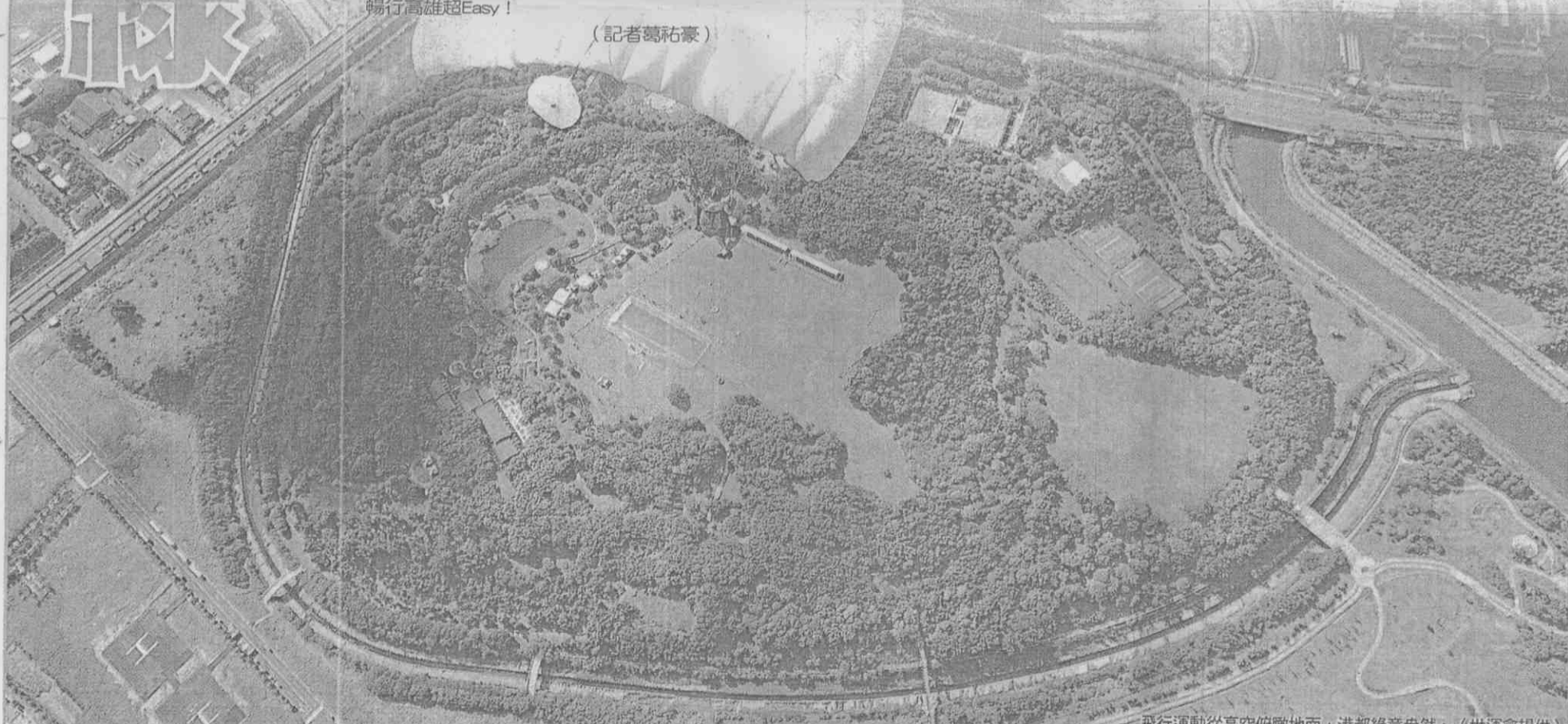
飛行運動從高空俯瞰地面，港都綠意盎然。