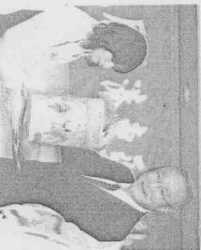
↑行政院長吳敦義（右）昨天設宴款待東亞運國手，感謝他們的辛勞，代表團由程琬容代表贈送東亞運吉祥物娃娃給院長。

台灣在本屆拿下8金34銀47銅，按國光體育獎章規定，金、銀牌各獲獎金30萬、15萬，體委會統計，本屆發出的獎金高達1655萬元。