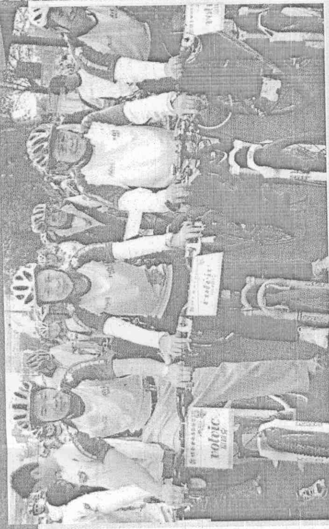
行政院體委會主委戴遐齡 打造全島單車友善環境

幸福，絕對值得你冒險挑戰，那將會是全台自行車路網最有樂趣的享受，原來主委戴遐齡早已經評比各路網的特色，一旦全部完工，就要PO上網全力介紹給所有民眾。