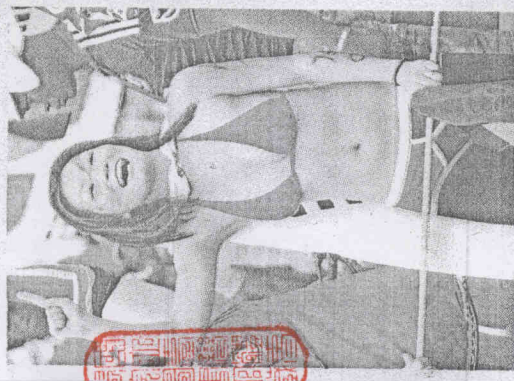
南韓與希臘之戰，一名南韓女性球迷不畏低溫，穿著火辣為球隊加油打氣。