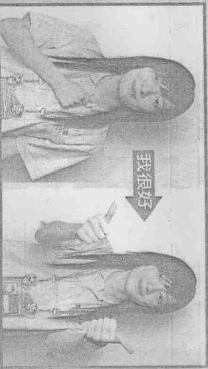
我，右手握拳放於胸；很好，雙手豎起大拇指往前伸。