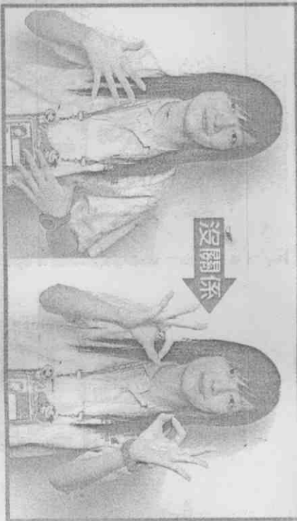
雙手五指伸開掌心向內上下搖動，再比OK狀往前伸。