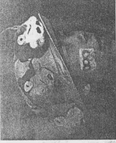
←一名日女著有物帽臉奧誌，冬運氣息。