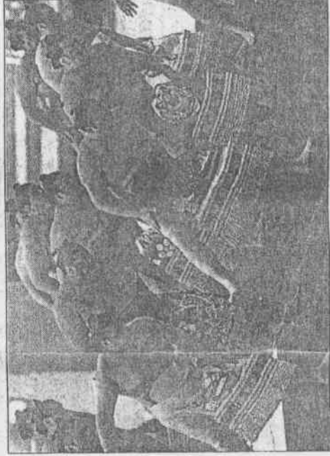
←日本相撲選手在冬運揭幕典禮上演「踏四股」驅魔。(路透社) ↓日本表演者環繞充氣地球模型起舞。(路透社)

●長野冬運一名消息人士表示，黛安娜王妃車禍喪生前數周，答應前來長野為冬運傳遞聖火。消息人士指出，主辦單位邀請黛安娜王妃持火炬傳遞聖火，同時可能請她在開幕式上祈求世界和平。