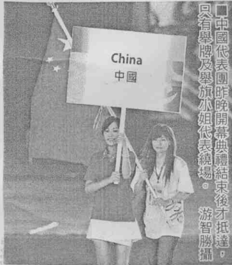
中國代表團昨晚開幕典禮結束後才抵達，只有舉牌及舉旗小姐代表繞場。

類似昨晚採取技術性迴避開幕式也非首例，2001年台灣主辦亞洲盃女足賽，當時總統陳水扁親自出席，中國女足隊決定臨時更改班機時間，開幕式結束才抵達台灣。更早之前，則有1997年在宜蘭冬山河舉行的第7屆亞洲盃划船錦標賽，當時的體委會主委趙麗雲應邀出席，中國代表隊則抵制不參加開幕式及歡迎酒會。