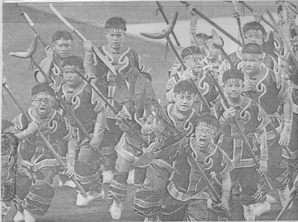
高雄市小朋友表演創意宋江陣。