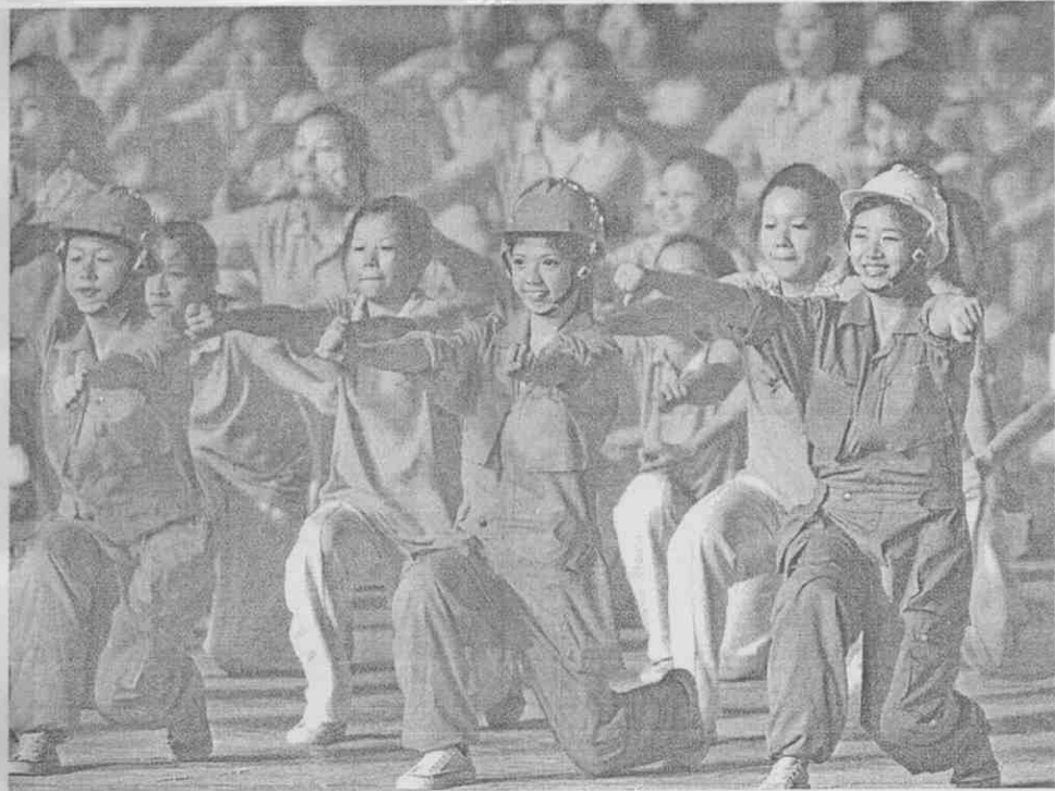
■鋼鐵城市節目展現高雄人的青春活力。