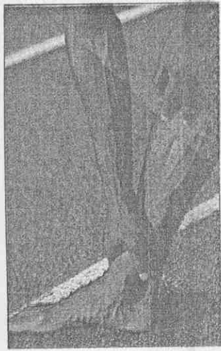
取材自/美國「運動畫刊」