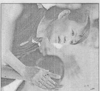
↓總統夫人周美青昨晚觀賞瓊斯盃籃球賽光華對哈薩克之戰，為兩隊球員鼓掌加油。