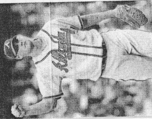
▲前勇士終結者雷茲馬將在北京奧運後結束球員生涯。