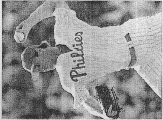
▲加拿大徵召有16年大聯盟經驗的老將柯米耶，以加強該隊的牛棚深度。