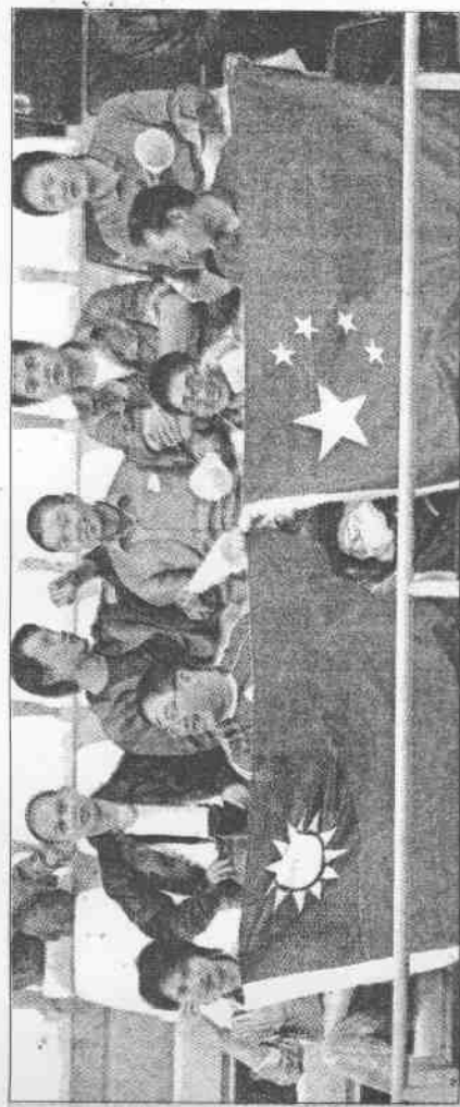
▲男籃賽場邊觀眾同時揮舞兩岸國旗為兩岸加油。

文祺最令球迷期待的畫面，莫過於當她眼觀四面耳聽八方，雙手交叉運球尋求助攻機會時，剎時間，彷彿小女生突然改變心意放下課本，翹頭出去聽五佰的演唱會。