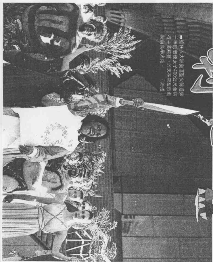
▲擔任五大洲奧運聖火傳遞第一棒的奧運女子400公尺金牌得主英莉曼，昨天在雪梨歌劇院前高舉火炬。