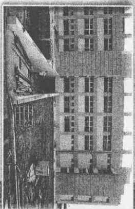
▲從車上拍攝選手村，這裡預定是中華隊的宿舍。特派記者侯永全／攝與傳真

【編譯劉潔昭／綜合外電報導】載運著雅典奧運聖火火車的「宙斯」號專機，昨天晨間中抵達第一站澳洲雪梨，接著由澳洲原任民田徑女將英莉曼擔任第一棒，展開奧運史上首次的五大洲聖火傳遞。